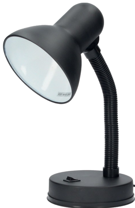
Ilustrační obrázek produktu